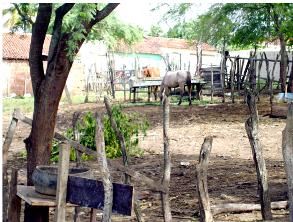
Imagem 09: Zona rural